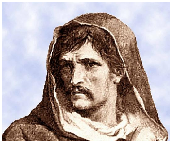
Bilde 1G. Bruno

Cosmos gjenoppliver den vitenskapelige martyrmysten om Giordano Bruno. Mange seere ble forundret over at så mye tid ble brukt i episode 1 på Giordano Bruno, et italiensk dominikanermunk, født i 1548 som verken var scientist eller bæret med noen vitenskapelig oppdagelse. Hvorfor det? Er det fordi han er den eneste med noe som kan ligne en vitenskapelig konfrontasjon ble drept av inkvisisjonen i den perioden? Som et resultat har Bruno blitt en ledende figur etter at den mytologiske krigføring mellom vitenskap og kristendom ble funnet opp i det 19.århundre.