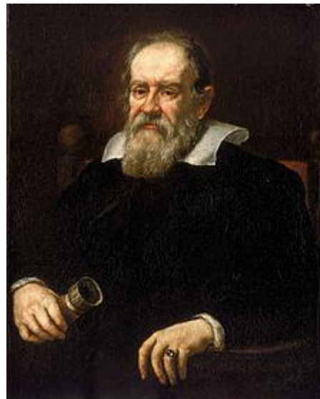
Bilde 4 Galileo Galilei

denne henseende. De får ikke med at kritikere av Brunos rolle i Cosmos også er kritisk til den katolske kirke på den tiden. Men latterliggjøring av forfølgelse av vitenskapsfolk er ikke egnet til underholdning. Også i våre dager mister folk jobben, eller får innskrenket sine karrieremuligheter grunnet intoleranse mot vitenskapelige synspunkter, som f.eks. strir mot neo-darwinsk evolusjonslære.