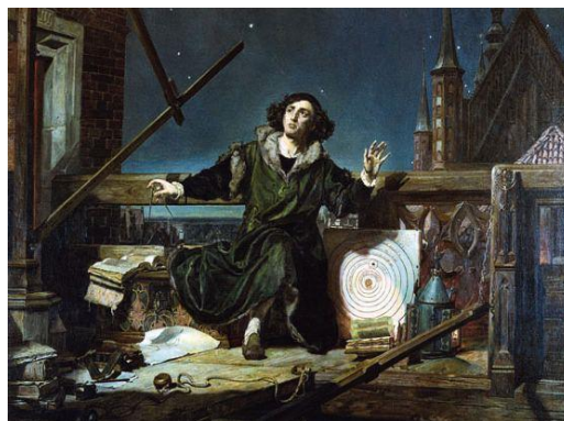
Bilde 2 N. Kopernikus

Kan det skyldes at Cosmos ikke bare er vitenskaps-utdannelse, men heller en påkostet serie med agiterende propaganda for vitenskapelig materialisme. Kopernikus døde fredelig i sin seng omtrent samtidig med at hans bok med det heliosentriske verdensbilde (On the Revolution of the Heavenly Spheres) ble gitt ut. Og selv om hans mest berømte disippel, Galileo, ble sensurert